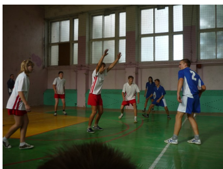
Победа близко. Ура! Мы ведём!

С самого начала игра была с Фоминической школой, которую наши ребята обыграли с большим отрывом. Следующей была команда Большежелтуховской школы, которую тоже неплохо обыграли. И вот при-