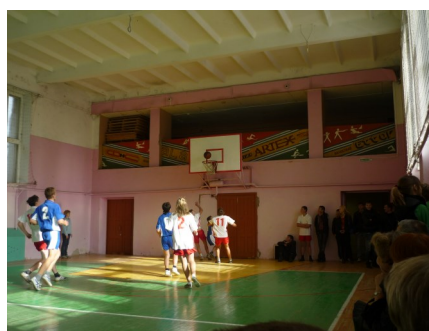
Острые моменты игры